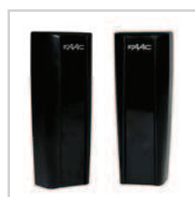
Fotokomórka Safebeam str. 107