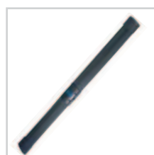
Listwa optyczna MSE 110W str. 112