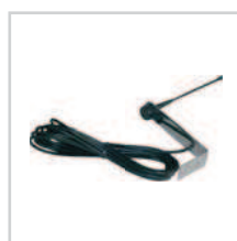
Antena str. 103