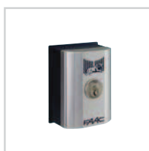
Wyłącznik kluczykowy str. 108