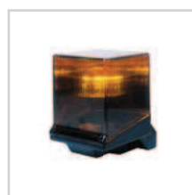
Lampa FAAC Light str. 106