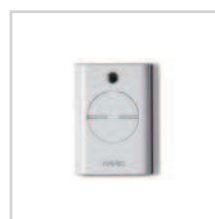
Pilot XT4 433 RC str. 102-103